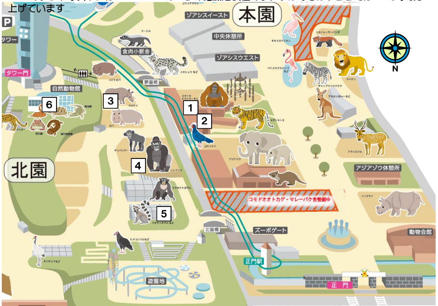
① スマトラオランウータン 霊長目ヒト科

IUCNのレッドリストにはCR・EN・VUの3つの絶滅危惧種のランクがあるが、ここではCRのみ取り上げています