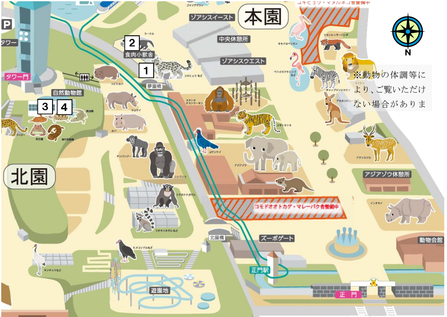
1 ジャングルキャット 食肉目 ネコ科